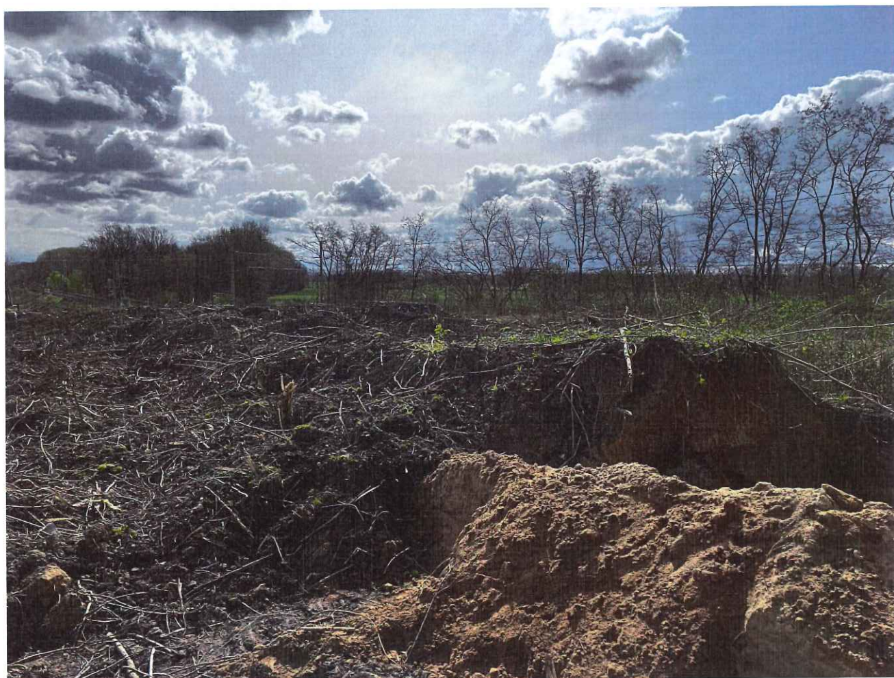
Obrázek 1: Místo kopané sondy